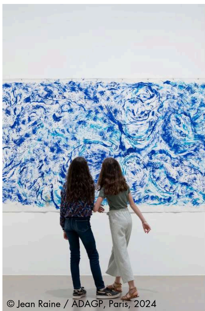
© Jean Raine / ADAGP, Paris, 2024

Des incontournables Rencontres de la photographie au Festival du Dessin, de l'élection de la tant attendue reine d'Arles à l'exposition "Van Gogh et les Étoiles", en passant par les festivités autour de la Flamme Olympique... Arles est rythmée toute l'année par une programmation culturelle variée et pointue et des manifestations traditionnelles qui font le sel de la ville et lui donnent une atmosphère si singulière.