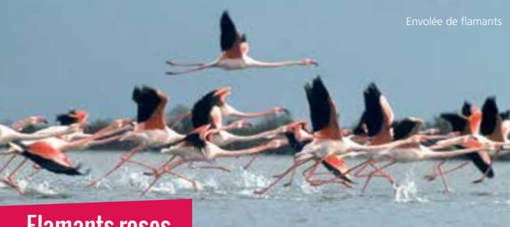
Envolée de flamants