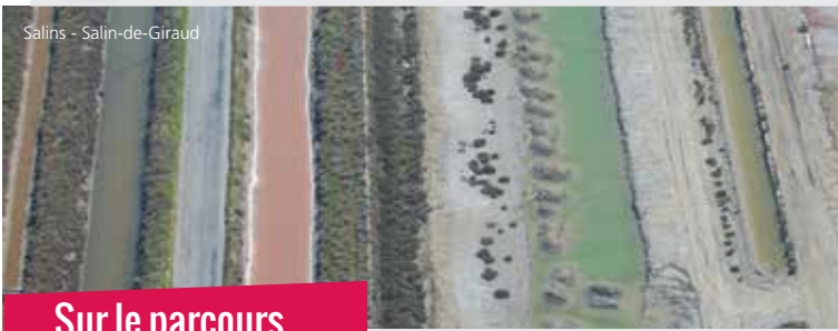
Salins - Salin-de-Giraud

Attention, veuillez consulter la météo avant de partir et éviter de randonner par temps de mistral